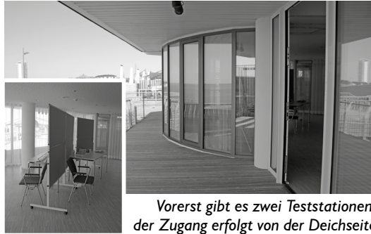
Vorerst gibt es zwei Teststationen, der Zugang erfolgt von der Deichseite