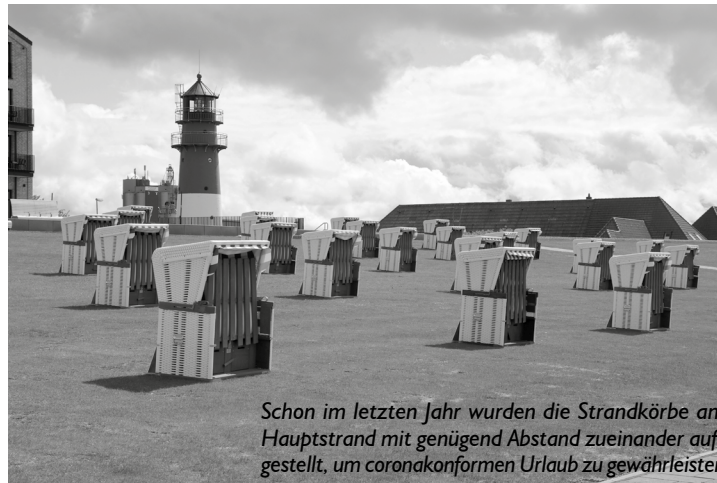
Schon im letzten Jahr wurden die Strandkörbe am Hauptstrand mit genügend Abstand zueinander aufgestellt, um coronakonformen Urlaub zu gewährleisten

Ab Dienstag werden am Hauptstrand und auf der Familienlagune über 600 Strandkörbe aufgestellt. Der Strandservice hilft dem Bauhof dabei die Strandkörbe richtig und mit genügend Abstand zu platzieren. Ab heute ist der Strandservice auch wieder in den Häuschen am Deich und auf der Familienlagune zu finden. Von Mai bis September beträgt die Tagesmiete 8,- Euro, für eine Wochenmiete ab 7 Tagen beträgt der Preis pro Tag dann nur noch 6,- Euro. Auch die große „RelaXXLounge“, ein Strandkorb für bis zu drei Personen, kann dann wieder gebucht werden für eine Tagesmiete von 10,- Euro. Die Saisonmiete für einen 2-Sitzer beträgt 350,- Euro.