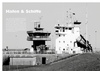
Ein kleiner Blick ins neue Heft

Ausgabe 2020, 92 Seiten ISBN 978-3-9815580-1-2, € 8,- Erhältlich im örtlichen Buch- und Zeitschriftenhandel www.buesumer-bullauge.de