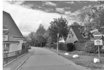
Diese beliebte Abkürzung ist nun für Autofahrer passé

Der Weg vom Altenhilfezentrum zum Marktplatz soll sicherer und bequemer werden, deshalb wird dieser Bereich umfangreich umgestaltet. Ein Knackpunkt ist dabei die Kreuzung Otto-Johannsen-Straße/Dithmarscher Straße/Hans-Reiher-Straße, die genau genommen aus zwei versetzten Einmündungen besteht. Diese Stelle ist unübersichtlich und besonders von Senioren nur schwer zu überqueren. Außerdem nutzen viele Schüler der benachbarten Schule diese Kreuzung. Um diesen Bereich verkehrlich zu entlasten wird die Einmündung zur Hans-Reiher-Straße künftig für Kraftfahrzeuge gesperrt. Außerdem wird sie zur Einbahnstraße und ist dann nur noch zwischen Lehnsweg