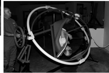
Nur was für Schwindelfreie: der Astronauten-Trainer

Das Erlebnismuseum „Phänomania“ lädt dazu ein, physikalische Phänomene mit allen Sinnen zu erleben. Plasmakugel, Trabi-Heber, Astronautentrainer: Diese und andere Attraktionen kann man in der Phänomania Büsum bestaunen. Rund 200 Experimentierstationen auf 6.000 Quadratmetern machen physikalische Phänomene und die Welt der menschlichen Sinne erlebbar. Dabei gilt: Anfassen