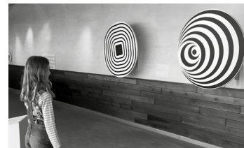
Spiel mit der optischen Täuschung: Rotierende Spiralen mit 3D-Effekt

Plasmakugel, Trabi-Heber, Riesenohren: Diese und andere Attraktionen kann man in der Phänomania Büsum bestaunen. Rund 230 Experimentierstationen auf 6.000 Quadratmetern machen physikalische Phänomene und die Welt der menschlichen Sinne erlebbar. Dabei gilt: Anfassen und Ausprobieren strengstens erlaubt. Erfahrene Guides sind dabei immer vor Ort, erklären