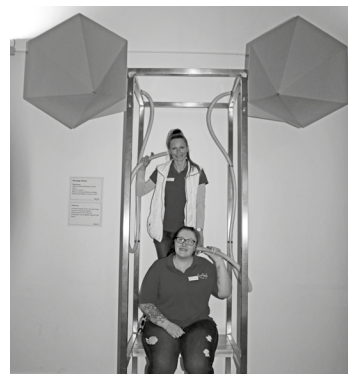
Diese Riesenohren verdeutlichen das Prinzip der Ohrmuscheln: Diese sammeln wie Trichter die Schallwellen und verstärken hierdurch das Signal. Hält man sich die Schläuche an die Ohren, kann man selbst leiseste Geräusche wahrnehmen.